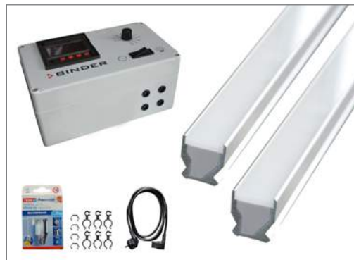
Комплект поставки базового набора