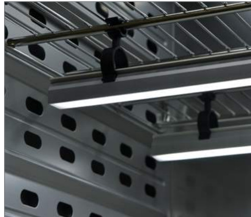
Световая планка 50 см, прикреплена при помощи пластиковых зажимов® к решетчатой вставной полке