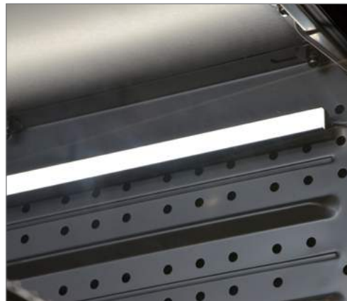
Световая планка 30 см, прикреплена при помощи tesa Powerstips® к стенке камеры