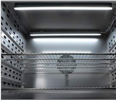
Световая планка 50 см, прикреплена при помощи tesa Powerstips® к потолку камеры