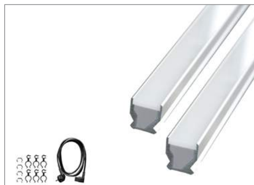
Комплект поставки набора для расширения